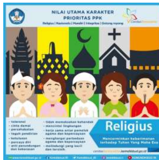
Gambar 2. Indikator Karakter Religius

keberagaman agama. Selain itu, karakter religius juga tercermin dalam perilaku anti kekerasan juga perundungan, menjunjung tinggi pertemanan, tidak memaksa kehendaknya, ketulusan, mencintai sesama terutama yang lemah serta melindungi lingkungan. Dengan demikian, penguatan karakter religius bukan sekedar berorientasi faktor ibadah, namun serta melingkupi pembentukan sikap sosial harmonis pada hidup bermasyarakat, sehingga murid mampu mewujudkan seseorang dengan akhlak mulia serta berkontribusi positif dalam lingkungan sekitarnya.