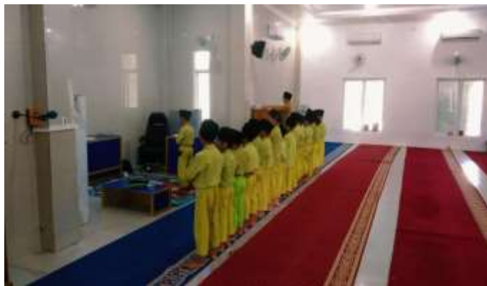
Gambar 1. Dokumentasi Kegiatan Praktik Ibadah Siswa Kelas II SD Islam Imam Nawawi Palangka Raya (Sumber: Data Olahan Peneliti, 2026).

Indikator keberhasilan dari serangkaian strategi di atas diukur oleh pihak sekolah dengan menyeluruh. Pada kerangka evaluatif komprehensif, pengukuran ini tidak semata bertumpu capaian kuantitatif, namun juga mempertimbangkan dimensi afektif dan pembiasaan perilaku murid dengan berkelanjutan. Berlandaskan temuan wawancara bersama guru serta umpan balik orang tua, ditemukan data bahwa siswa mengalami peningkatan kedisiplinan yang signifikan. Konstruksi data ini memperlihatkan adanya korelasi intervensi pedagogis yang diimplementasikan dengan transformasi sikap yang